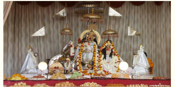
GOVIND DEVJI TEMPLE