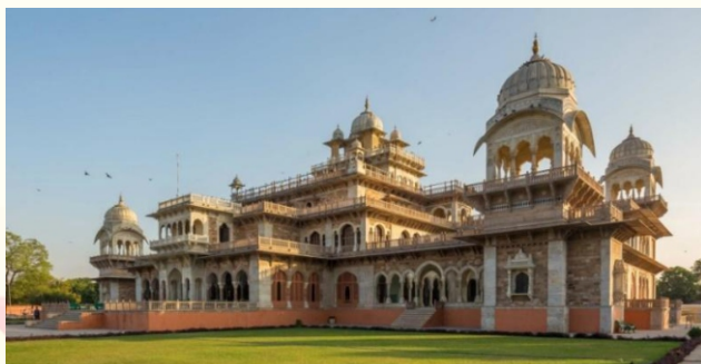
ALBERT HALL MUSEUM